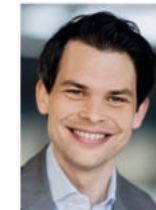
Dr. Christoph Ploß MdB Koordinator der Bundesregierung für Maritime Wirtschaft und Tourismus