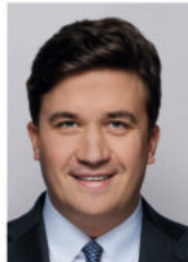
Lukas Krieger MdB Mitglied im Finanzausschuss des Deutschen Bundestages