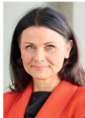
Gitta Connemann MdB Parlamentarische Staatssekretärin im Bundesministerium für Wirtschaft und Energie