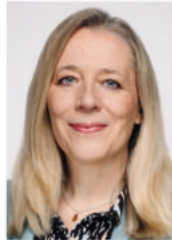
Kerstin Radomski MdB Mitglied im Haushaltsausschuss des Deutschen Bundestages