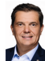
Oliver Pöpsel MdB Mitglied im Finanzausschuss des Deutschen Bundestages