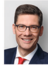
Christian Hirte MdB Parlamentarischer Staatssekretär im Bundesministerium für Verkehr