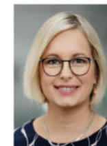
Dr. Christiane Schenderlein MdB Staatsministerin für Sport und Ehrenamt