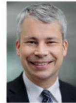
Steffen Bilger MdB Erster Parlamentarischer Geschäftsführer der CDU/CSU-Bundestagsfraktion