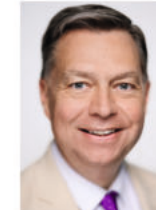
Stephan Mayer MdB Vorsitzender der AG Sport und Ehrenamt der CDU/CSU-Bundestagsfraktion