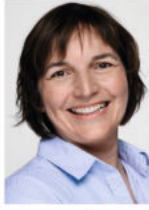
Mareike Wulf MdB Parlamentarische Staats- sekretärin im Bundesmi- nisterium für Bildung, Familie, Senioren, Frauen und Jugend