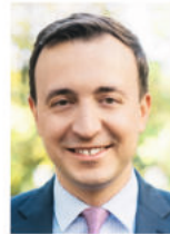
Paul Ziemiak MdB Generalsekretär des CDU Landesverbandes Nord- rhein-Westfalen