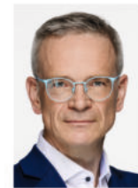
Dr. Markus Reichel MdB Mitglied im Ausschuss für Arbeit und Soziales des Deutschen Bundestages