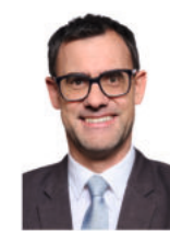
Ralph Edelhäußer MdB Mitglied im Verteidigungsausschuss des Deutschen Bundestages