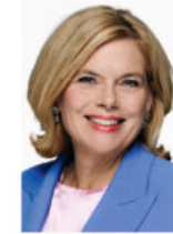
Julia Klöckner MdB Präsidentin des Deutschen Bundestages