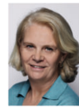
Dr. Saskia Ludwig MdB Mitglied im Ausschuss für Wirtschaft und Energie des Deutschen Bundestages