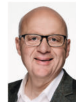
Alexander Radwan MdB Mitglied im Auswärtigen Ausschuss des Deutschen Bundestages