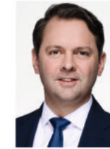
Dr. Andreas Lenz MdB Vorsitzender der AG Wirtschaft und Energie der CDU/CSU-Bundestagsfraktion