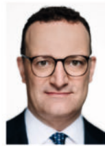
Jens Spahn MdB Fraktionsvorsitzender der CDU/CSU-Bundes- tagsfraktion