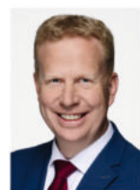
Henning Rehbaum MdB Mitglied im Verkehrsausschuss des Deutschen Bundestages