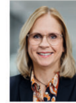
Andrea Lindholz MdB Vizepräsidentin des Deutschen Bundestages