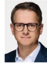
Dr. Carsten Linnemann MdB Generalsekretär der CDU Deutschlands