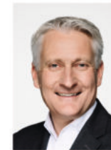
Hansjörg Durz MdB Vorsitzender des Ausschusses für Digitales und Staatsmodernisierung des Deutschen Bundestages