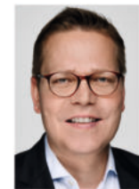
Tino Sorge MdB Parlamentarischer Staatssekretär im Bundesministerium für Gesundheit