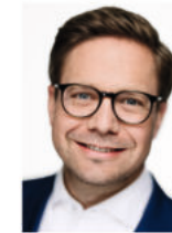
Fabian Gramling MdB Mitglied im Ausschuss für Wirtschaft und Energie des Deutschen Bundestages