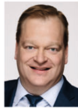
Albert Stegemann MdB Stellvertretender Frak- tionsvorsitzender der CDU/CSU-Bundestags- fraktion