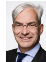
Dr. Matthias Middelberg MdB Stellvertretender Fraktionsvorsitzender der CDU/CSU-Bundestagsfraktion