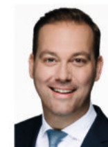
Felix Schreiner MdB Parlamentarischer Geschäftsführer der CDU/CSU-Bundestagsfraktion