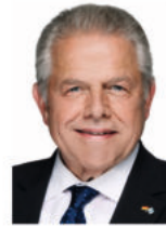
Klaus-Peter Willsch MdB Mitglied im Haushalts- ausschuss des Deutschen Bundestages