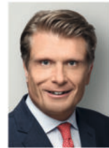
Thomas Bareiß MdB Mitglied im Haushaltsausschuss des Deutschen Bundestages