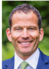
Albert Rupprecht MdB Stellvertretendes Mitglied im Finanzausschuss des Deutschen Bundestages