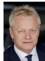
Alois Rainer MdB Bundesminister für Landwirtschaft, Ernährung und Heimat