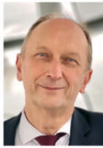
Dr. Klaus Wiener MdB Obmann der CDU/CSU- Bundestagsfraktion im Ausschuss für Wirtschaft und Energie des Deut- schen Bundestages