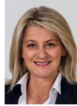
Mechthilde Wittmann MdB Mitglied im Haushalts- ausschuss des Deutschen Bundestages