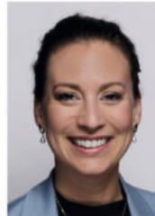
Caroline Bosbach MdB Mitglied im Ausschuss für Landwirtschaft, Ernährung und Heimat des Deutschen Bundestages