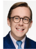
Philipp Amthor MdB Parlamentarischer Staatssekretär im Bundesministerium für Digitales und Staatsmodernisierung