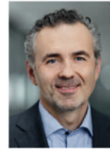
Thomas Jarzombek MdB Parlamentarischer Staatssekretär im Bundesministerium für Digitales und Staatsmodernisierung