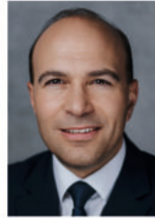
Florian Oßner MdB Obmann der CDU/CSU-Bundestagsfraktion im Haushaltsausschuss des Deutschen Bundestages