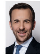
Bastian Ernst MdB Vorsitzender der PKM-Kommission Verteidigungsindustrie